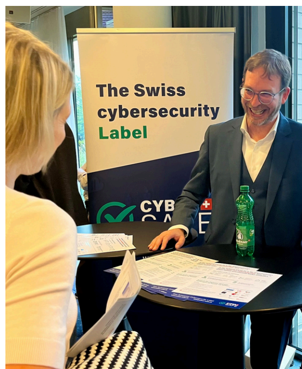
Conférence nationale sur la cybersécurité, Berne, 26.09.2024